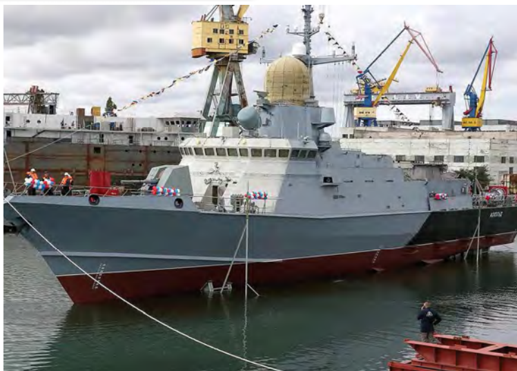
La frégate Askold à flot lors de son lancement

Les préfixes USS et HMS, bien que faisant partie des noms des bâtiments américains et britanniques armés, ont été omis pour alléger la lecture.