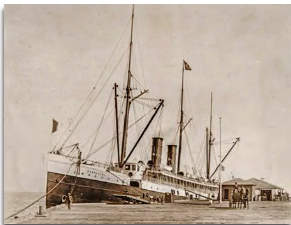
Ci-contre : le paquebot SS Santa Rosa , victime de la côte en 1911. (DR)

Le Santa Rosa , échoué et brisé en deux. Des rescapés sont sur la plage. (DR)