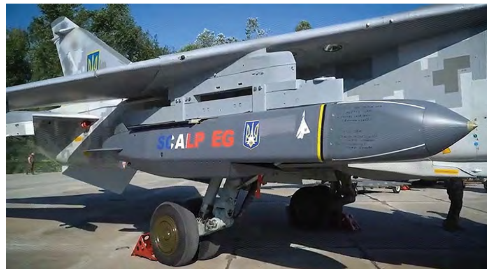
Ci-dessus : Un missile SCALP installé sur un Su-24 Fencer en août 2023.

Une vidéo de la frappe a été diffusée, sur de nombreux réseaux et sites. Elle montre clairement une frégate à quai, l'Askold. Un premier missile est visible, suivi d'une explosion et d'un dégagement de fumée. Quelques secondes plus tard, deuxième explosion, plus puissante. Des photos prises ultérieurement, durant la nuit, montrent des dommages importants. Si le navire est toujours à flot, il semble bien que l'essentiel des superstructures ait été détruit. Le bâtiment,